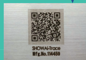
銘板に印字して製品に取付