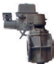
エキセントリックバルブ 電動式