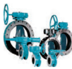
バタフライバルブ