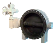
Fig61~64 リングセット型 バタフライ弁