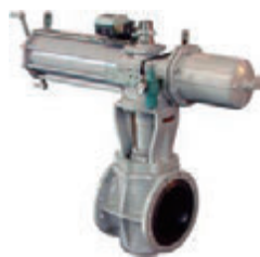
エキセントリックバルブ 空気シリンダ式