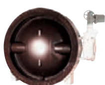
Fig182 AW型 バタフライ弁