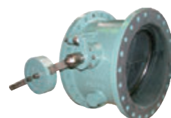
Fig180 ティルティング逆止弁