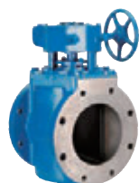
エキセントリックバルブ 手動ギア式