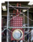
Fig105 ドレッジバルブ (浚渫船、下水用)